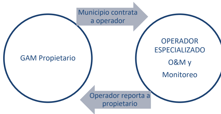
Figura 1: Modelo de gestión.

El modelo de gestión apropiado al contexto local y a los requerimientos de los Municipios de Cliza y Tolata se determinó con el concurso de autoridades municipales de los gobiernos municipales. El modelo de gestión elegido entre varias alternativas es el que se presenta a continuación en la Figura 1.