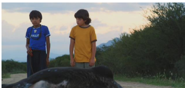
Figura 6 - Posición según un grado mayor de empatía.