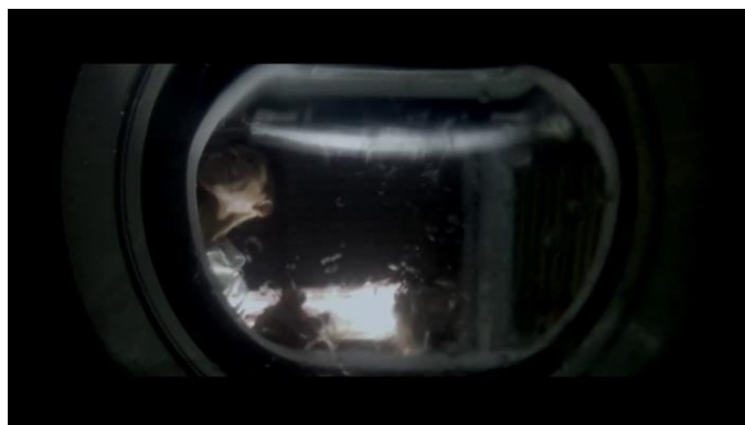
Figura 13 - Las lavadoras como metáfora de la identidad en la posmodernidad líquida.

relaciones y que las hace precarias, transitorias y volátiles. En este sentido, la identidad dentro de esta sociedad de consumo, adopta adjetivos como ondulante, espumosa, resbaladiza y acuosa [13]. Quizás por esta razón, Piñeiro decide representar la modernidad líquida de Bauman a través de la paradoja de una lavandería que ensucia y corrompe este lado de la frontera boliviana, logrando desestabilizar la categoría de la identidad y desarticular cualquier tipo de discurso de unidad nacional. Esta paradoja la vemos anunciada tempranamente en el prólogo, con la lavadora llenándose de espuma en el momento que Celestino asoma su rostro para ver cómo funcionan. Desde un plano nadir del interior de la lavadora, vemos como la espuma tapa lentamente el rostro de Celestino, anticipándonos su negro futuro. A lo largo del relato, las lavadoras de Amazonas funcionarán como metáfora de la identidad descentrada e inestable en la modernidad líquida de Bauman [13] (Fig.14), representando a Celestino como un deshecho humano dentro de un Estado del desperdicio. Y su decadencia física, su muerte en la frontera, como un espacio que nos separa, violentamente, del imaginario Estado-nación.