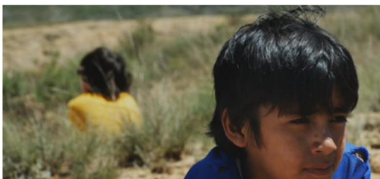
Figura 5 - Posición según el grado de poca empatía.

Por último, como sexto factor, RAV parece sugerir cómo sólo a través del afecto y la empatía podemos reducir la brecha que separa al ESTE / BLANCO del OESTE / INDÍGENA de Bolivia y conectarnos con “el otro” distinto de nosotros. La única vez que la barrera parece quebrantarse es cuando los dos niños se interesan por los problemas del otro. Al comienzo del film, un plano medio encuadra al niño indígena buscando a su vaca con el niño blanco de espaldas mostrando desinterés. Cerca del final de Amarillo tenemos un plano medio similar cuando los dos niños contemplan la vaca muerta del niño indígena, pero esta vez el niño del ESTE se encuentra físicamente parado al lado del niño indígena, conmovido por su drama. En otra secuencia, se resalta la compasión que crece en el niño indígena por la frustración del niño chapaco al no poder encontrar la manera de regresar a su casa. A través de estas tomas, el filme sugiere cómo las posiciones de los niños cambian de acuerdo a su mayor o menor empatía (Fig. 5-7).