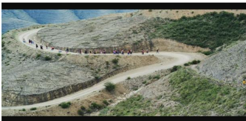
Figura 3 - Campesinos dirigiéndose a la ciudad.

Por otro lado, la escena en la que el grupo de campesinos marchan, como una masa humana hacia la ciudad, a través del uso de panorámicas extendidas, vincula una vez más a la masa de gente como parte del paisaje nacional. Sin embargo, en RAV , la masa de gente aparece en la escena como una fila de hormigas, recorriendo una superficie para finalmente infestar un lugar. Aquí existe un paralelismo con la escena de hormigas que estaban siendo exterminadas en la casa del niño del ESTE / BLANCO sugiriendo no la unión de Bolivia sino todo lo contrario. (fig. 3-4).