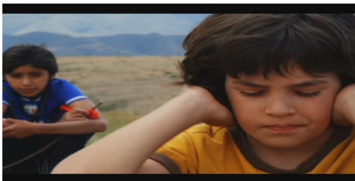
Figura 7 - Posición según un grado de empatía.

RAV finalmente cierra con primeros planos de las tres madres tristes con la mirada perdida, unificando de esta manera las tres historias y a las tres regiones, no bajo el símbolo de unión que representa la bandera boliviana, sino bajo la imagen pesimista de una madre en lágrimas. La madre queda como el lugar simbólico del desencuentro, dejando en claro que, por ahora, los bolivianos, estamos huérfanos (Fig. 8 - 10).