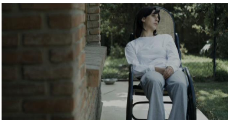
Figura 8 - Madre en Rojo .

RAV finalmente cierra con primeros planos de las tres madres tristes con la mirada perdida, unificando de esta manera las tres historias y a las tres regiones, no bajo el símbolo de unión que representa la bandera boliviana, sino bajo la imagen pesimista de una madre en lágrimas. La madre queda como el lugar simbólico del desencuentro, dejando en claro que, por ahora, los bolivianos, estamos huérfanos (Fig. 8 - 10).