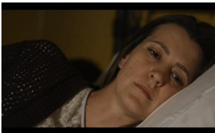
Figura 9 - Madre en Amarillo .