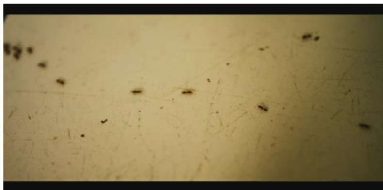
Figura 4 - Hormigas infestando la casa del niño del ESTE.

Por último, como sexto factor, RAV parece sugerir cómo sólo a través del afecto y la empatía podemos reducir la brecha que separa al ESTE / BLANCO del OESTE / INDÍGENA de Bolivia y conectarnos con “el otro” distinto de nosotros. La única vez que la barrera parece quebrantarse es cuando los dos niños se interesan por los problemas del otro. Al comienzo del film, un plano medio encuadra al niño indígena buscando a su vaca con el niño blanco de espaldas mostrando desinterés. Cerca del final de Amarillo tenemos un plano medio similar cuando los dos niños contemplan la vaca muerta del niño indígena, pero esta vez el niño del ESTE se encuentra físicamente parado al lado del niño indígena, conmovido por su drama. En otra secuencia, se resalta la compasión que crece en el niño indígena por la frustración del niño chapaco al no poder encontrar la manera de regresar a su casa. A través de estas tomas, el filme sugiere cómo las posiciones de los niños cambian de acuerdo a su mayor o menor empatía (Fig. 5-7).